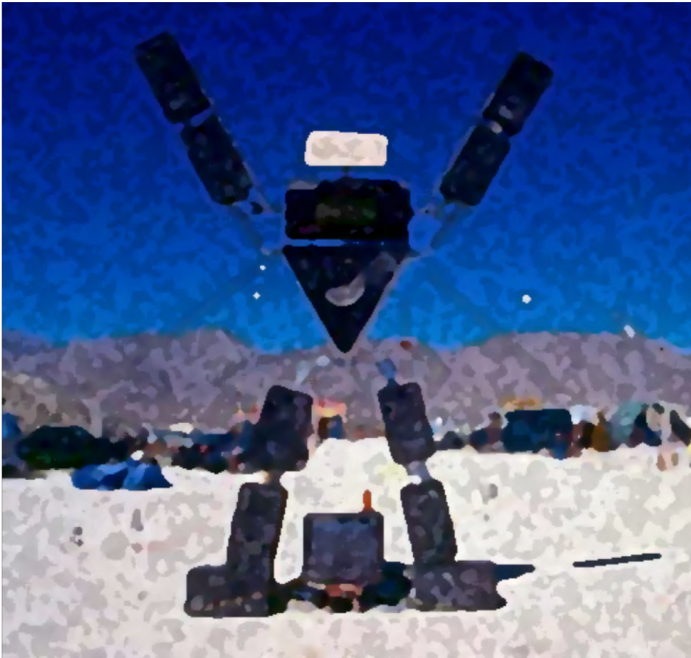
Fiche n° 17 : Le régime juridique applicable aux « rave-parties ».