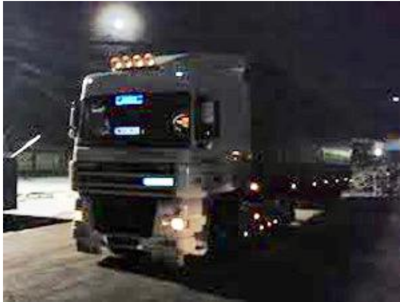
Fiche n° 20 : Livraisons nocturnes et règle de l'antériorité