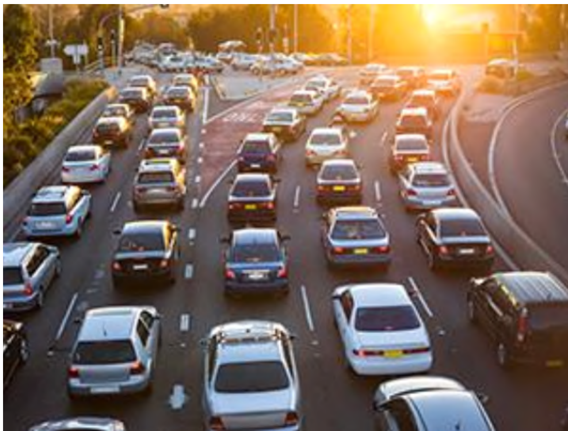
Fiche n° 2 : Lutte contre le bruit des transports terrestres

L a lutte contre le bruit des transports terrestres routiers et ferroviaires consiste, essentiellement, à limiter les nuisances sonores générées par les infrastructures de transports terrestres ( C. envir, art. L. 571-9, L. 571-10 et R. 571-32 et s ).